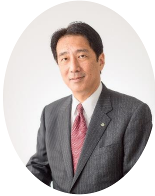
能美市長 井出 敏朗

第 45 回北信越国民スポーツ大会が、能美市において、各県から多くの選手・監督並びに役員の皆様をお迎えし、盛大に開催されますことをお慶び申し上げますとともに、市民を代表して心から歓迎申し上げます。